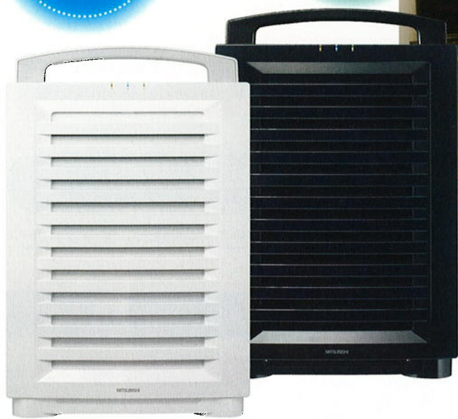
DA-8000A(ホワイト/ブラック)