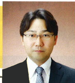
ホームページ用の写真。でもこの写真よく見ると…

S44.4.18 (株)ヤマックス 代表取締役 長崎市小江町 2734-75 TEL095-846-7777 FAX095-846-7242