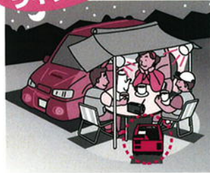
夜間の照明やオーディオ機器の電源として