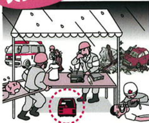
無線機や電子機器の電源として