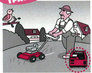
小型電動工具や充電器の電源として