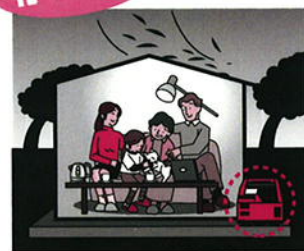
電気ポット、ライト、炊飯器等家庭用電源として