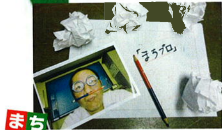
まちプロ ~町田編集長がゆく~