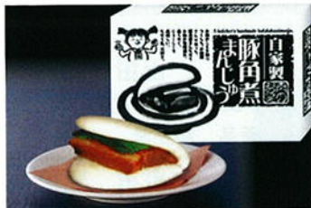
あらまちはがい ホントはこちら！！

梅雨が終われば当然、夏！ 夏といえば～ 海だ！ 山だ！ B BQだ！！ BBQ以外になにかある！ 誰がなんと言おうとBBQだ！ なぜここまで強引にBBQに持っ て行くのか？ それは じゃ～ん！！