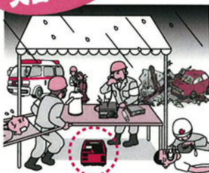
無線機や電子機器の電源として