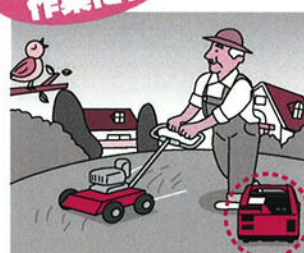
小型電動工具や充電器の電源として