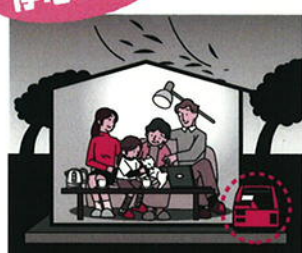
電気ポット、ライト、炊飯器等家庭用電源として