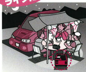
夜間の照明やオーディオ機器の電源として