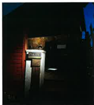
こんな感じとか～ のお手伝いをしております。