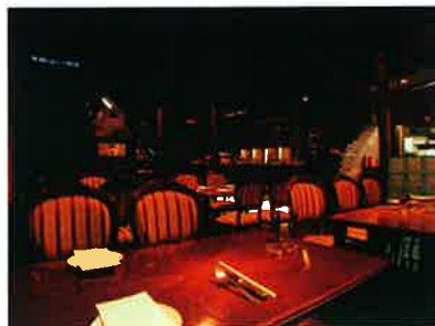
こちらは福岡のお店です。

ゼロからのスタートはコンセプトから始めますから これがおもしろい！し、一番大切な部分でもありますから 相当の時間を掛けます。 このコンセプトを練り込んだだけ、後がずんなりと流れて行くようです。 逆にここがあやふやだと・・・。