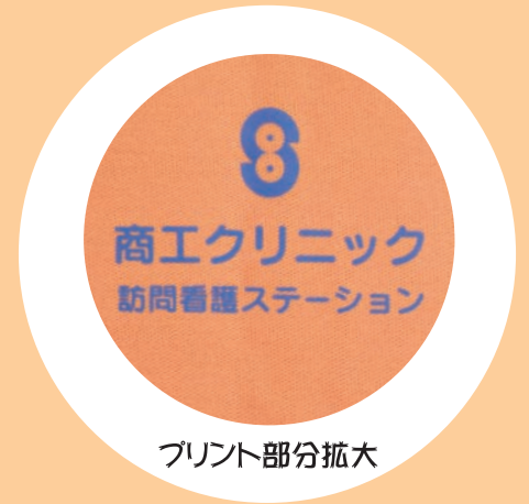
プリント部分拡大