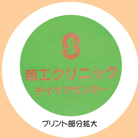
プリント部分拡大